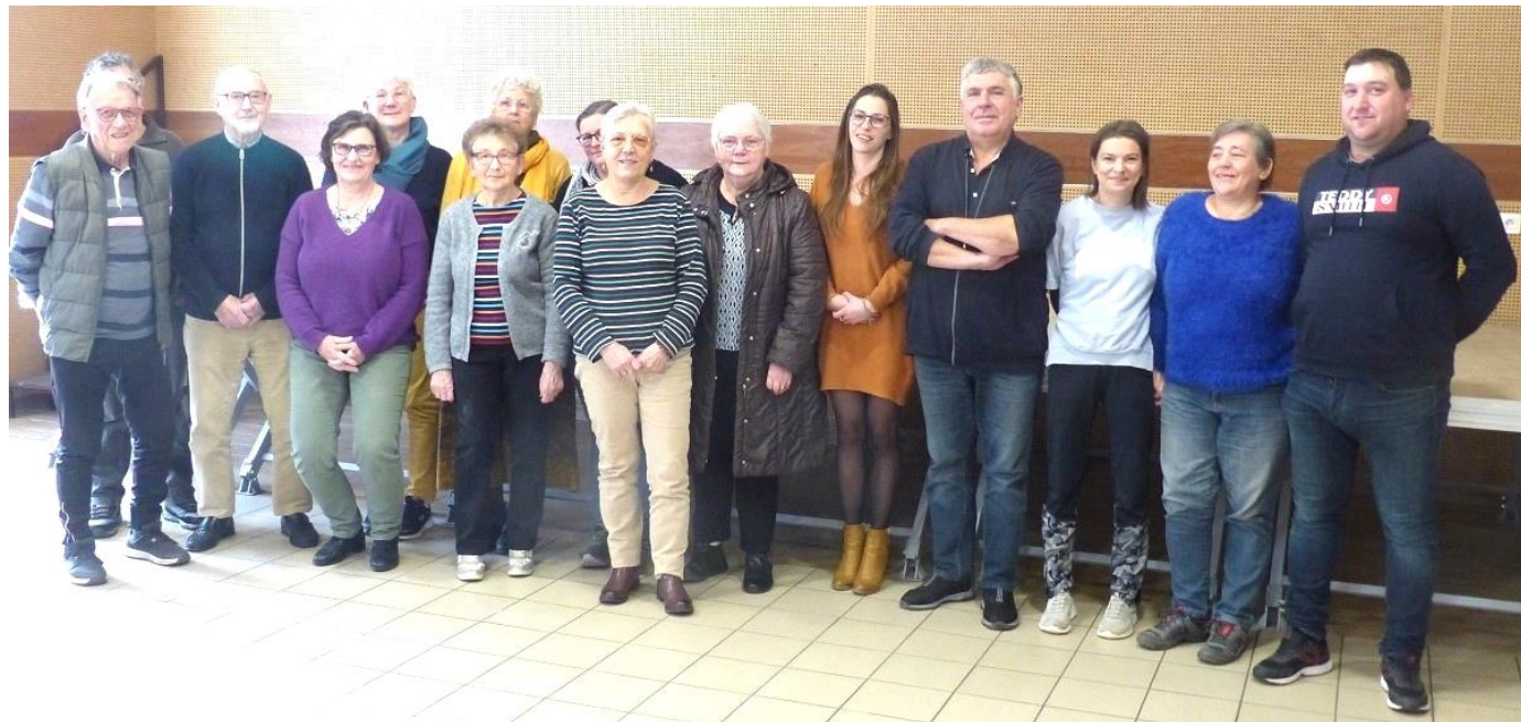
Quelques photos des bénévoles des associations de Franchesse

En fin d'année, les associations de la commune ont été réunies pour bâtir le calendrier des manifestations de 2025. Le maire s'est réjoui du dynamisme des associations qui proposent une belle palette d'activités et de nombreux moments conviviaux. De nouveaux bénévoles seraient les bienvenus.